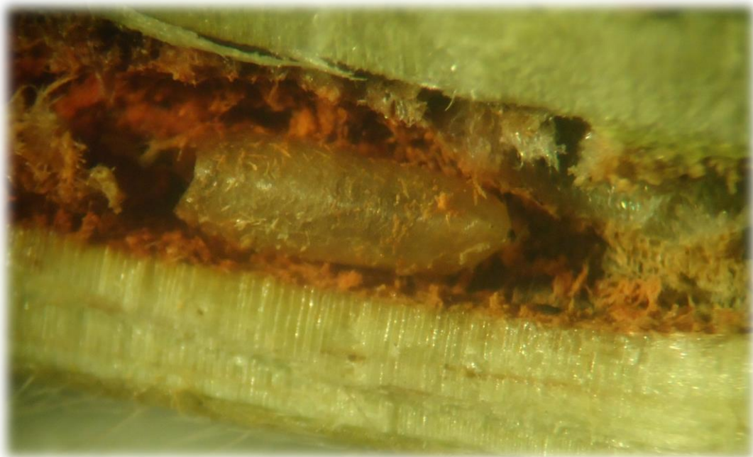
Figura 2. Tallo de soja barrenado, con pupa abierta de la mosca.

En la mayoría de los tallos con galerías visibles se encontraron pupas abiertas de la mosca (Figura 2) por lo que se estima que la larva pudo haber barrenado entre 15 y 20 días atrás.